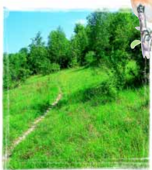
Perchés sur les quelques arbustes des pelouses, les passereaux comme le Tarier pâtre (ci-dessus) sont à l'affût des insectes.

Fin XIX e début XX e , l'exploitation extensive de ces terrains était un complément indispensable aux modes de production d'alors. Les troupeaux de moutons paissaient en libre parcours le long de la Cuesta sous la conduite d'un berger et de ses chiens. Puis vers le milieu du XX e siècle, les cours de la laine s'effondrent, l'agriculture évolue, les pelouses sèches sont peu à peu abandonnées, s'embroussaillent et sont colonisées plus ou moins rapidement par les bois.