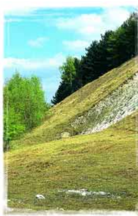
Certains larris hébergent des pelouses rases favorables aux végétations pionnières.