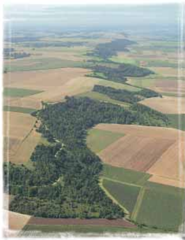
Cette vue aérienne, près de Ons-en-Bray, illustre bien l'importance des boisements tout au long de la Cuesta du Bray.

Particularité du site, des ravins peu accessibles, humides du fait de leur encaissement, de l'importante pluviométrie et de leur exposition au nord, constituent un milieu original favorable aux peuplements de tilleuls, érables, ormes et frênes. Cette ambiance montagnarde, sur de faibles superficies au sein du Pays de Bray, explique la rareté de ces forêts. Du fait de la pauvreté des sols et du morcellement parcellaire, l'exploitation habituelle des bois est généralement extensive.