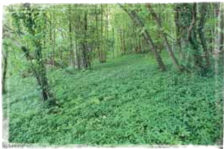
Tapis herbacé dominé par la Mercuriale pérenne sous une Hêtraie-Frênaie.

Les bois sont très morcelés, leurs propriétaires actuels ayant hérité de parcelles de petites tailles issues des partages multiples au cours des temps. Les peuplements d'arbres qu'on y rencontre sont variables mais souvent composés d'un taillis de charme, bouleau, noisetier avec quelques tiges de futaie d'érable sycomore, de chênes pédonculé et sessile, de hêtre, de frêne, de châtaignier et de merisier.