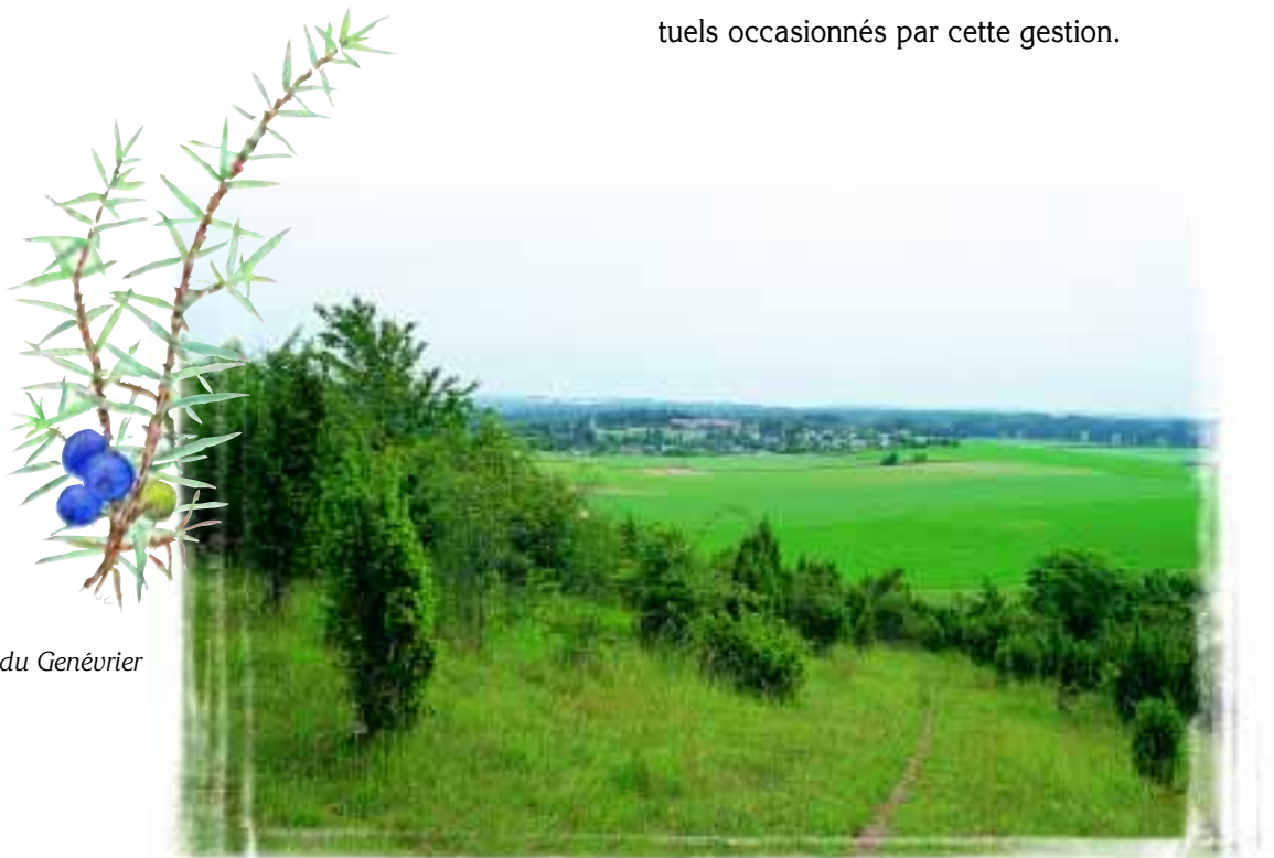
Baies du Genévrier

Dans ces contrats d'une durée de cinq ans, le propriétaire ou l'utilisateur s'engagera à gérer ses terrains selon le descriptif des opérations et des engagements inclus au contrat. En contrepartie, il recevra des compensations financières pour les surcoûts éventuels occasionnés par cette gestion.