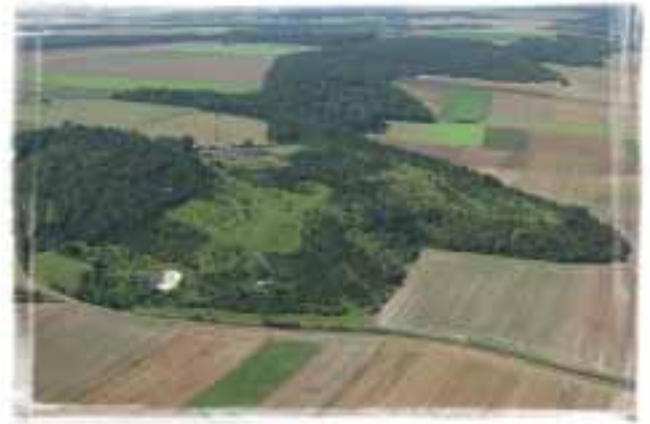
Vue aérienne de la Cuesta, près de Berneuil-en-Bray.

Cette directive européenne a été transcrite en droit français par l'ordonnance du 11 avril 2001 et ses décrets d'application.