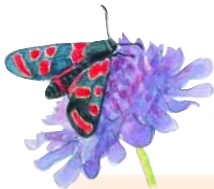
Zygène de Carniole

Une gestion, parfois une restauration, pourra être mise en œuvre de façon concertée en tenant compte des exigences économiques, sociales et culturelles ainsi que des particularités régionales et locales.