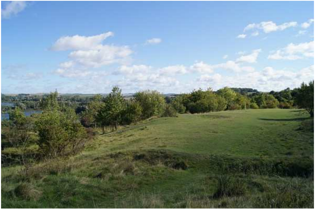
Le No man's land