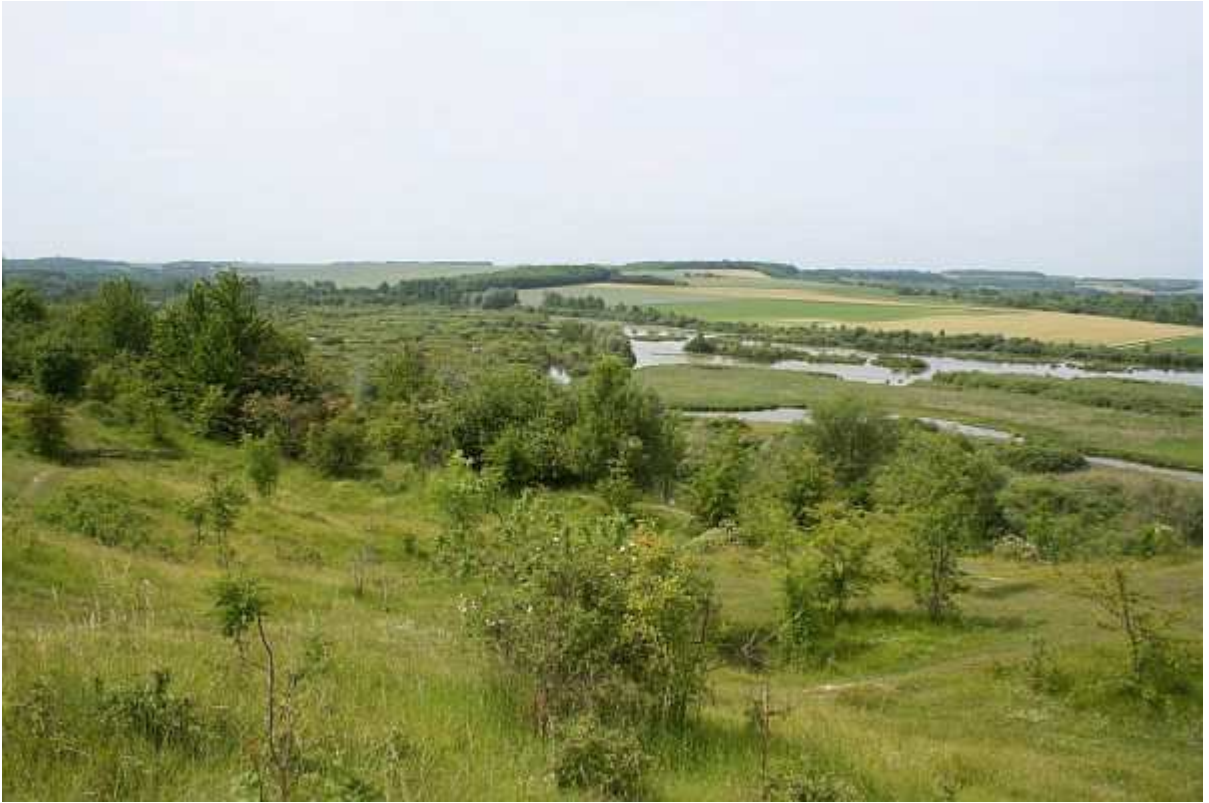
Vue sur les marais depuis le haut de la Montagne de Frise