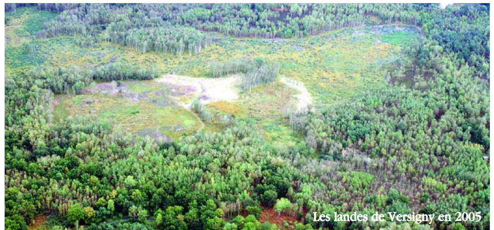
Les landes de Versigny en 2005

Ce décapage a permis de remettre à jour les graines des plantes enfouies dans le sol depuis une vingtaine d'années et de retrouver d'ici 2 à 3 ans un paysage composé de landes et de prairies.