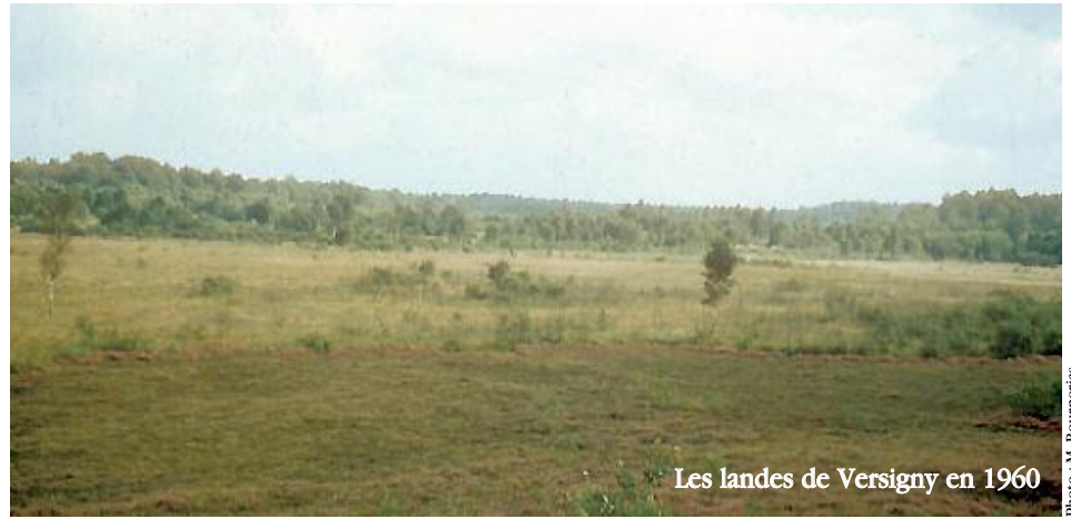
Les landes de Versigny en 1960

Depuis plusieurs années, le Conservatoire des sites naturels de Picardie réalise des travaux de gestion sur les landes de Versigny. Ces travaux ont été discutés et validés avec les représentants des usagers locaux et de la mairie puis les membres du comité consultatif.