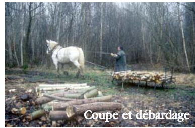
Coupe et débardage

Leur objectif est de retrouver une surface suffisante de landes et de prairies pour assurer la survie des espèces d'animaux et de plantes présentes nulle part ailleurs en Picardie pour certaines. De plus, nous tentons de remettre en état le paysage qui existait dans les années 60 comme le montre les photos que nous possédons. Ce paysage se caractérisait par la présence de grands espaces ouverts mélangés aux bois.