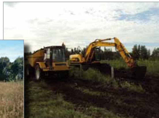
... et de restauration