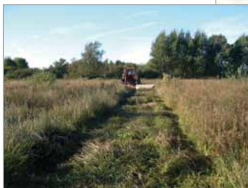
Des travaux d'entretien...