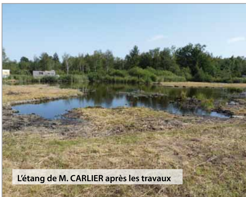
L'étang de M. CARLIER après les travaux

L'objectif pour ce contrat était donc de mettre en place des mesures de restauration du milieu sans qu'elles soient préjudiciables à l'activité chasse du gibier d'eau, bien au contraire.